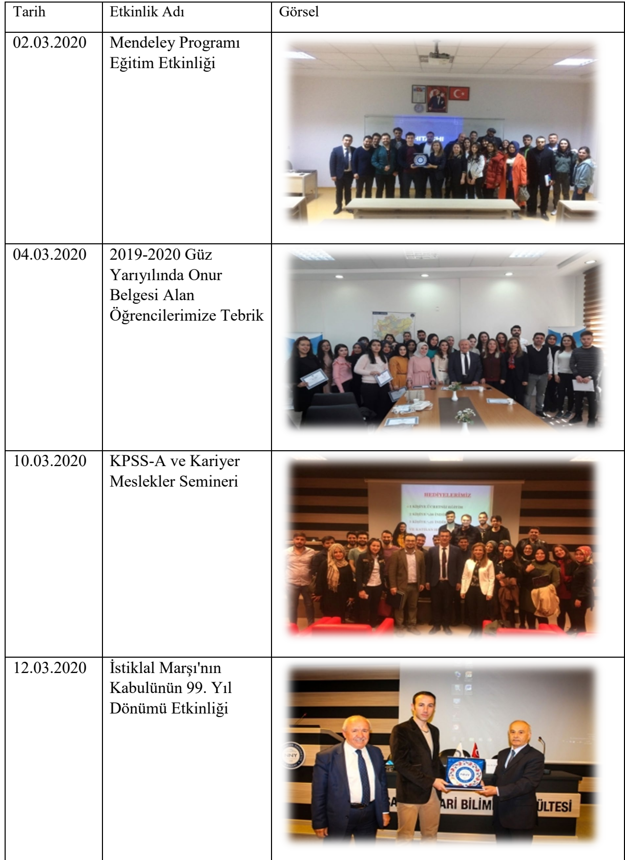
Tablo 21. İktisat Bölümü 2020 yılı Etkinlikler Listesi

İktisat Bölümde 2020 yılı itibariyle yürütülen etkinlikler aşağıda sunulmuştur.